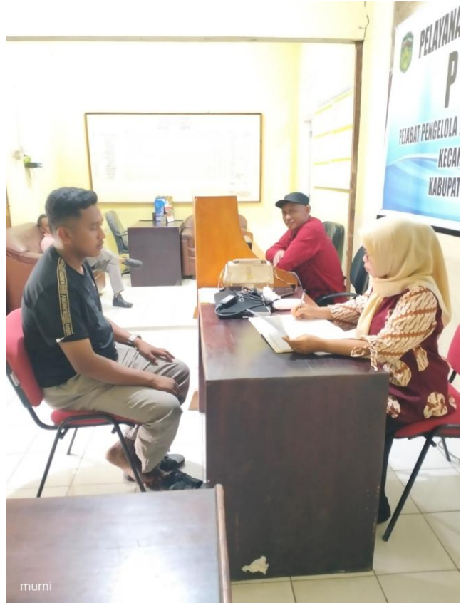
Pengurusan Dokumen Penduduk Pindah Datang