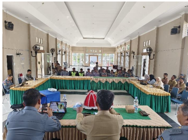
Pembinaan dan Pelatihan Satlinmas