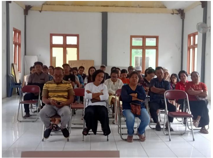
Kegiatan Sosialisasi Bumdes Se-Kecamatan Tomoni di Aula Desa Bangun Jaya