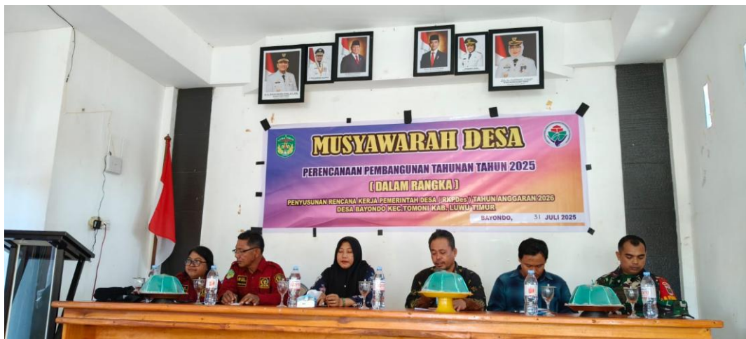
Musdes RKPdes tahun 2026 Desa Bayondo