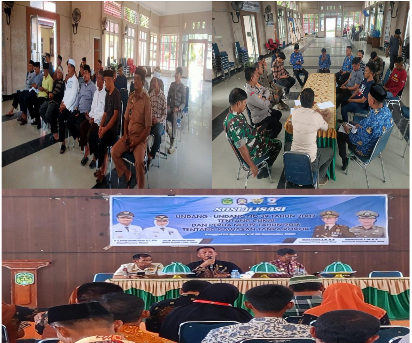
Pertemuan dengan Tokoh Agama dan Kepala Desa, Penyelesaian senketa, dan sosialisasi perda