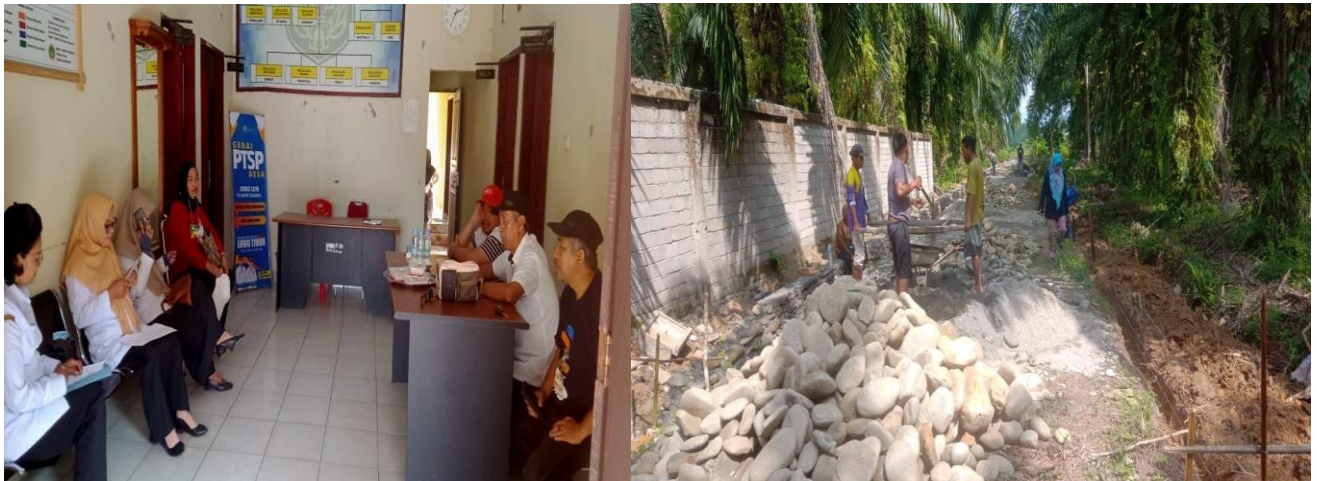
Monev Dana BKK