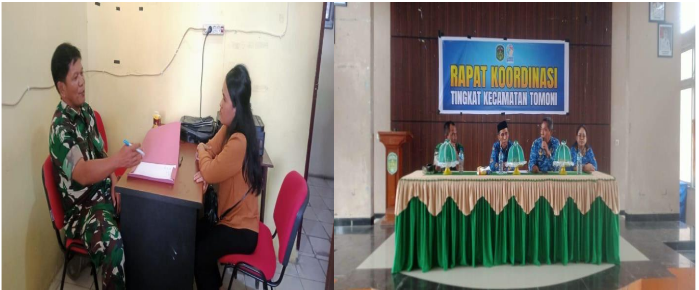
Seleksi Perangkat Desa, dan Forum Komunikasi Pimpinan Tingkat Kecamatan (Forkopimcam)