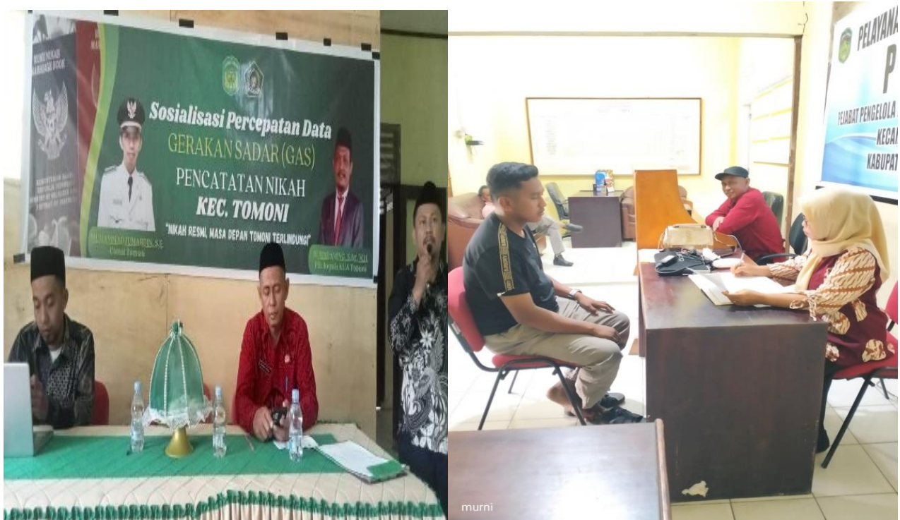
Pelaksanaan Pelayanan Kependudukan dan Fasilitasi Sosialisasi percepatan data pencatatan nikah