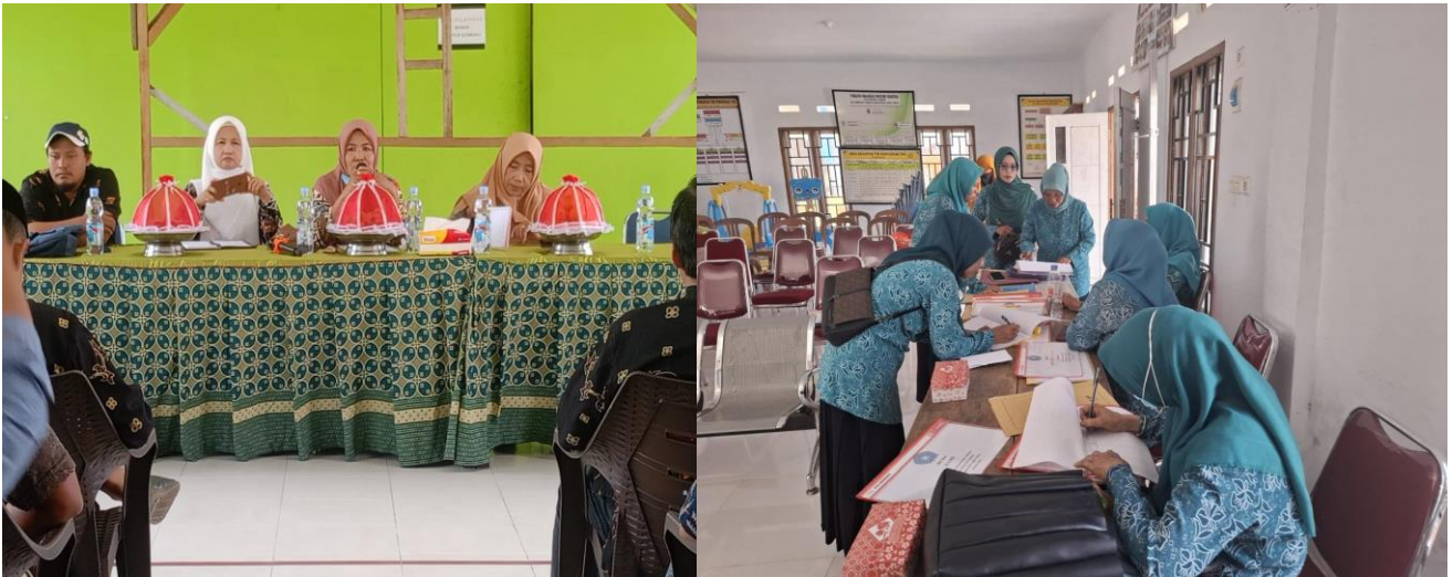
Kegiatan Sosialisasi Bumdes Se-Kecamatan Tomoni, PKK